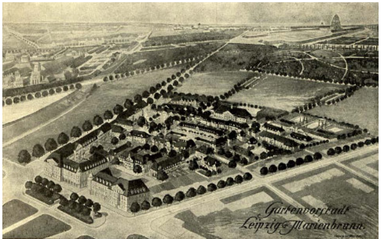
Planung Marienbrunn auf einer Postkarte aus dem Jahr 1912