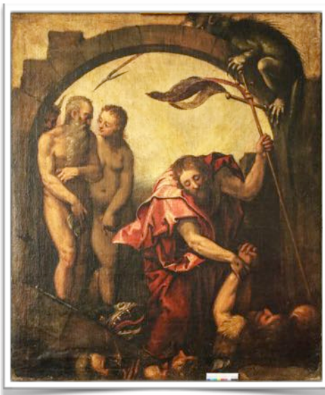
Gesamtaufnahme während der Retusche

Übrigens: Unser Gemeindehaus hat uns sogar ein Geschenk gemacht! Hinter einem Archivschrank, der abgebaut wurde, tauchte im Herbst 2015 ein Leinwandgemälde auf, welches vermutlich 1668 hinter dem Schrank versteckt wurde. Es zeigt ein besonders religiöses Motiv: Die Höllenfahrt Christi. Als Auferstandener möchte er, dass die Botschaft des Lebens auch dort gesagt wird, wo nur noch der Tod ist. Er geht in die Unterwelt, um sogar den Verstorbenen die gute Nachricht zu predigen: Der Heilige ist ein Gott des Lebens.