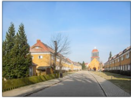
Reihenhäuser mit Blick zur katholischen Kirche