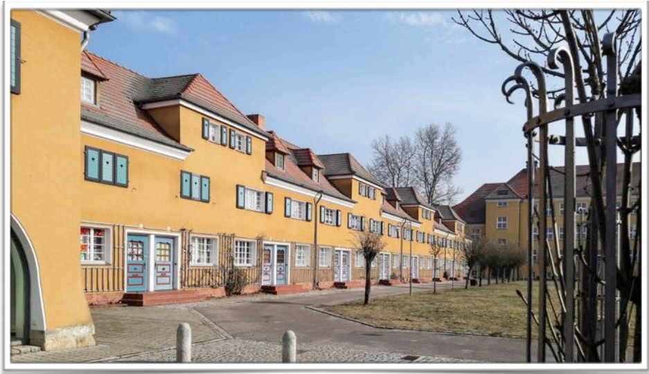
Reihenhäuser mit Lucas-Cranach-Gymnasium

bergt heute das soziale Zentrum mit Vereins- u. Ausstellungsräumen, Beratungsstellen und diversen Info-Einrichtungen. Beeindruckend ist, dass in den einzelnen Bebauungsgruppen eine vollständige Einheitlichkeit erhalten bzw. wieder hergestellt wurde, die sich bis hin zu den Gartenhäusern erstreckt.