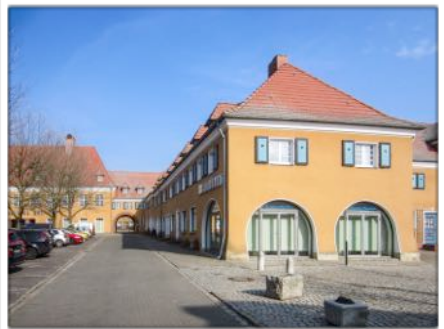
Ehemalige Läden am zentralen Platz mit ehem. Kaufhaus, später Hotel Piesteritzer Hof