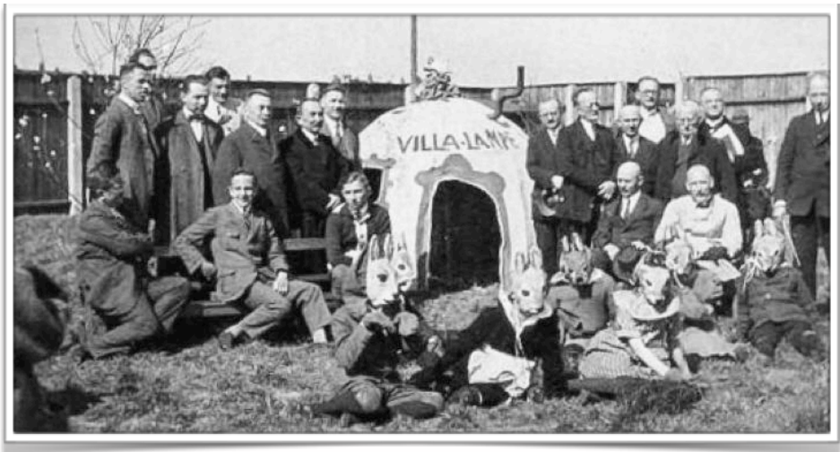
Ostern in Marienbrunn

Wir wünschen Ihnen ein schönes und fröhliches Osterfest und einen guten Start in den Frühling! der Vorstand