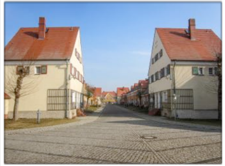
Reihenhäuser der Gartenstr. mit Blick zum Torhaus

tatsächliche die vollständig Sanierung, die Grundlage des heutigen Eindruckes ist. Herausragendes Kriterium ist u.a., dass die Siedlung autofrei ist. Nur auf dem zentralen Platz darf geparkt werden, eine Zufahrt zu den Wohnhäusern ist nur zum Be- und Entladen gestattet und für die Anwohner stehen Richtung Werk ausreichende Garaghöfe und Dauerparkplätze zur Verfügung.