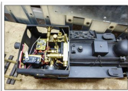
Harzer Schmalspur Bahn (HSB) 996102

Jetzt loderte das Echtdampffeuer und eine weitere Lokomotive nach dem Vorbild der Harzer Schmalspur Bahn (HSB) 996001 entstand in zwei Wintern harter Arbeit.