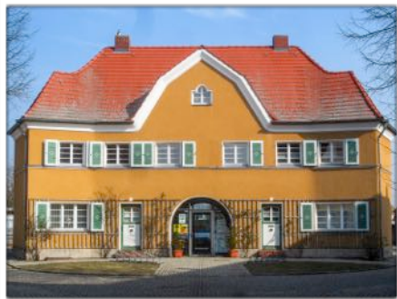
Torhaus am Zugang zur Siedlung, heute Treffpunkt, Info-Stelle, Vereinsitz

Das gibt der Siedlung, trotz ihrer Intimität und Wohnlichkeit eine Transparenz, Offenheit und Ruhe, die sofort auffällt. Die kleinen Läden sind, wie sooft, geschlossen und jetzt teilweise Büros und Gewerberäume, das Kaufhaus war zwischenzeitlich ein aufstrebendes Hotel, wird aber jetzt für Wohnzwecke umgenutzt (mit weiterer öffentlicher Nutzung einzelner Säle und Räume), die katholische Kirche ist aktiv in Betrieb, die übrigen öffentlichen Gebäude (wie das nicht mehr erforderliche Rathaus) sind zum Lucas-Cranach-Gymnasium zusammengefasst worden. Das Torhaus beher-